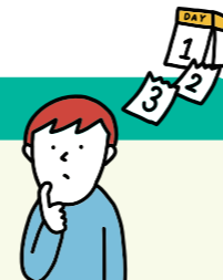
図表●厚生年金保険の加入期間のある妻が平成20年4月以前に第3号被保険者となったケース

請求は、原則、離婚等をした日の翌日から 5年以内 に行う必要があります。令和8年3月以前に離婚等をした場合の期限は、その日の翌日から起算して 2年以内 となります。